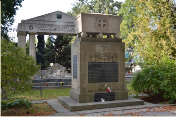
Pomnik – mogiła Rokitniańczyków, na drugim planie pomnik – mogiła żołnierzy z I wojny światowej, Cmentarz Rakowicki