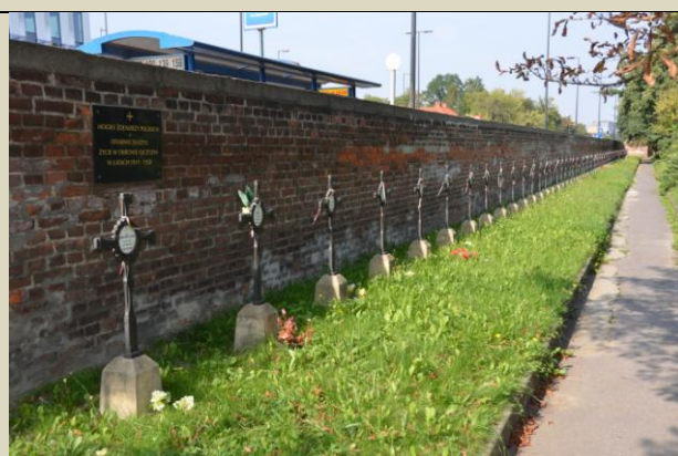
Kwatery żołnierzy z I wojny światowej, Cmentarz Rakowicki