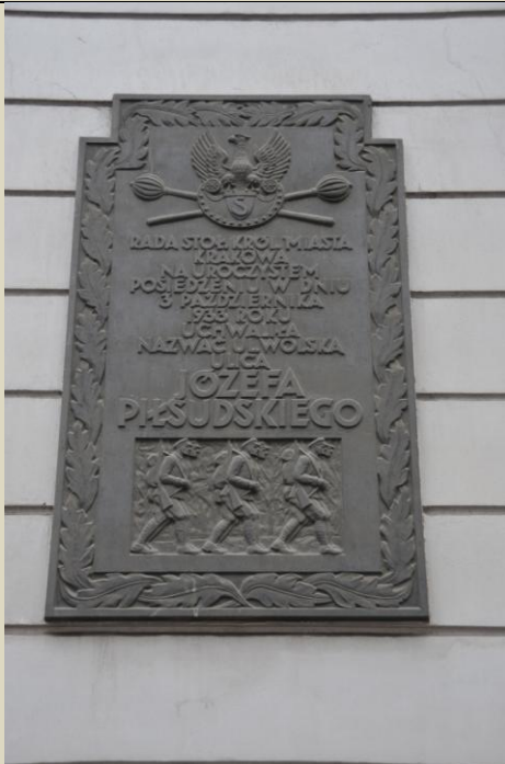
Tablica przy ulicy Piłsudskiego