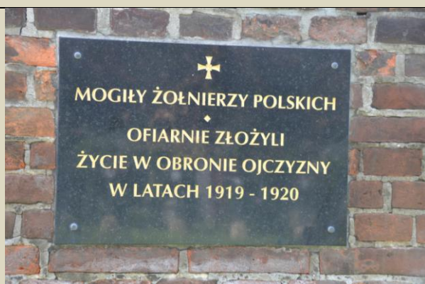
Tablica na Cmentarzu Rakowickim