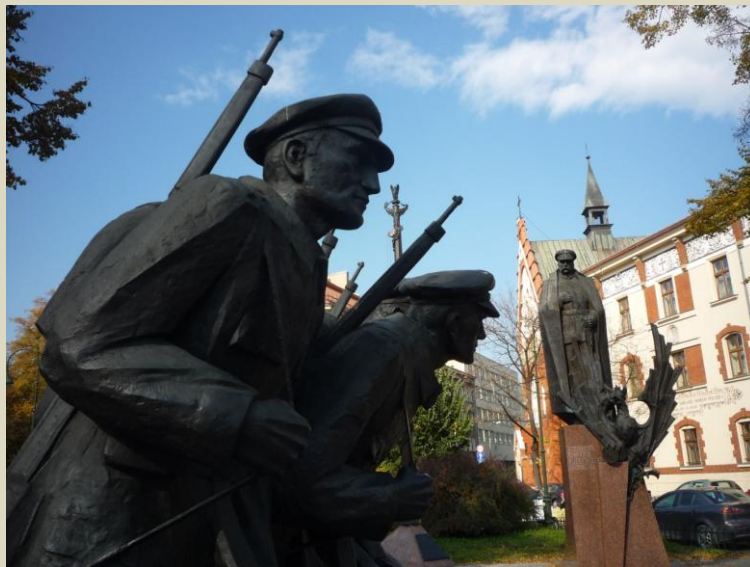
Pomnik Józefa Piłsudskiego (Czesława Dźwigają) odświeżony w 2008 roku.