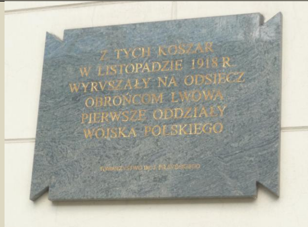
Tablica przy ulicy Rajskiej