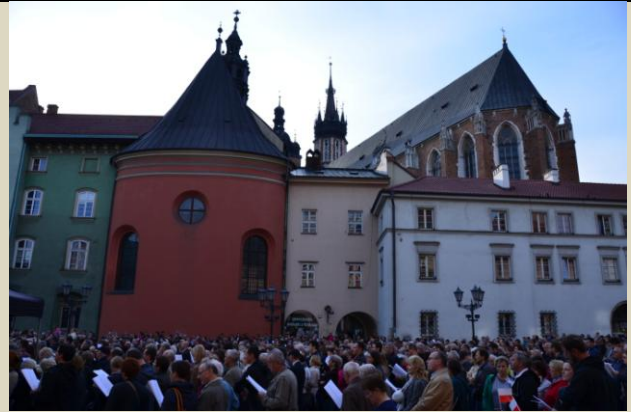
Lekcja Śpiewania, sierpień 2018