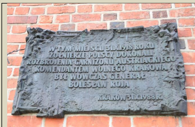
Tablica na Wieży Ratuszowej, strona wschodnia