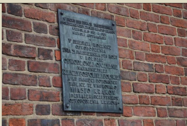
Tablica na Wieży Ratuszowej, strona północna